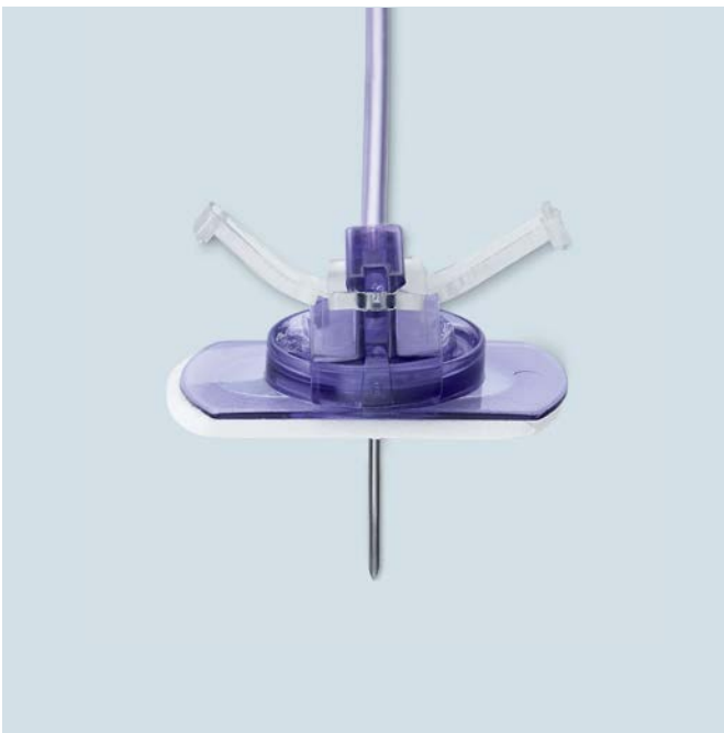
(1) vor der Benutzung