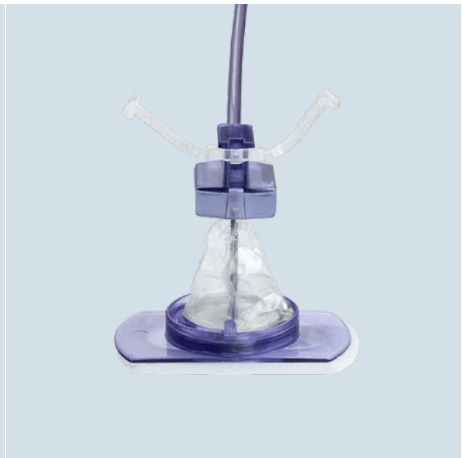
(2) nach der Benutzung